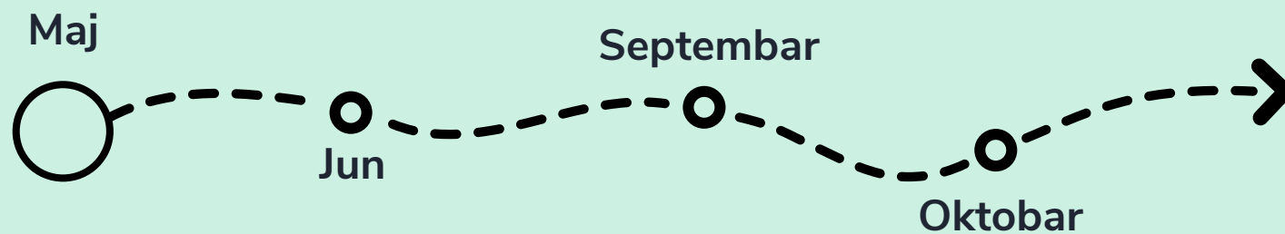
Ciklus kampova za nove polaznike